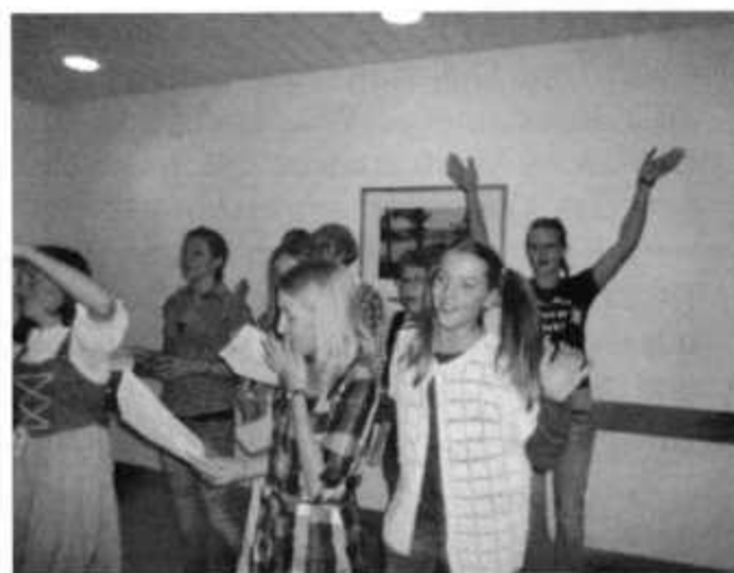
Jugendfreizeit 2011 Konstanz – Spieleabend