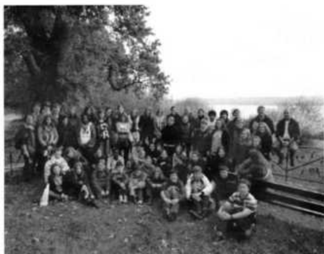
Jugendfreizeit 2011 Konstanz