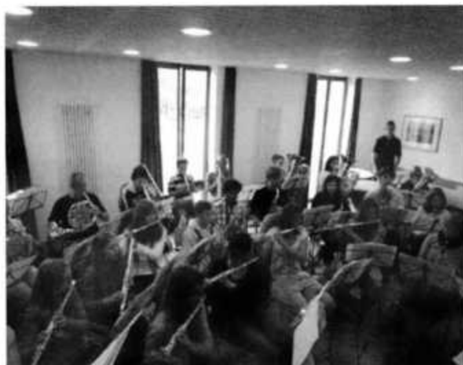
Jugendfreizeit 2011 Konstanz - Probe