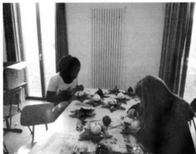
Jugendfreizeit 2011 Konstanz – Jugendvorspielnachmittagsvorbereitungen